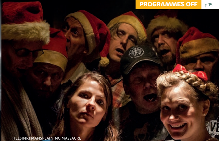
HELSINKI MANSPLAINING MASSACRE