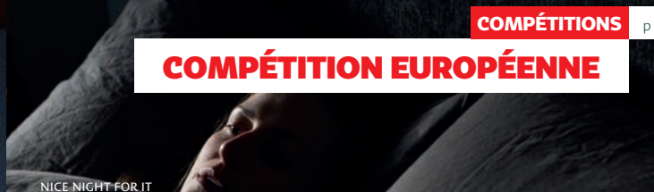
NICE NIGHT FOR IT