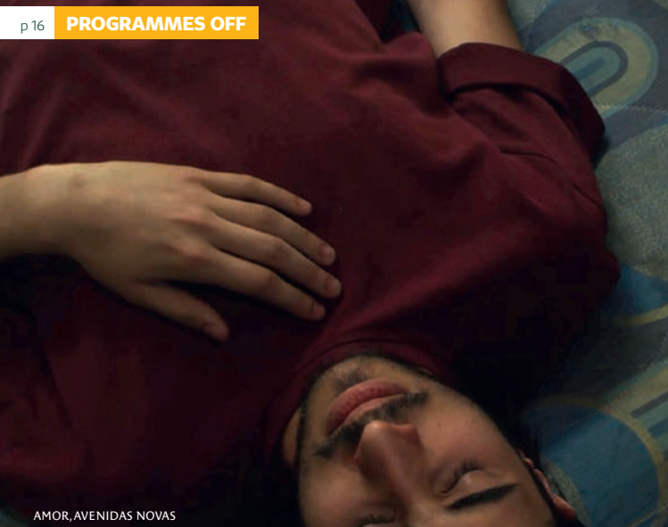
AMOR, AVENIDAS NOVAS