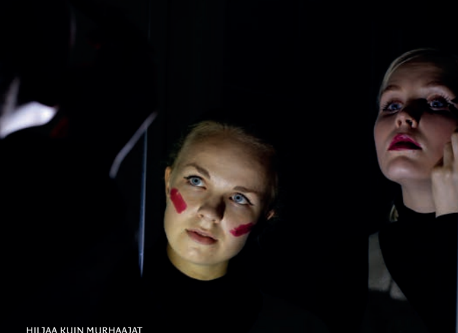
HILJAA KUIN MURHAAJAT