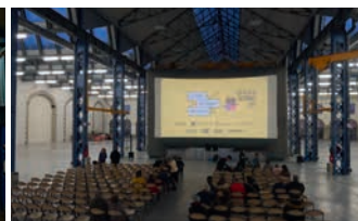
FÊTE DU COURT 2016