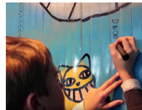
MUR DE PELLICULE